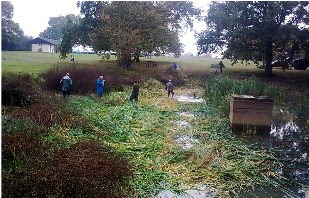
ETANG AMONT: nettoyage par les bénévoles GN le 29 octobre 2011