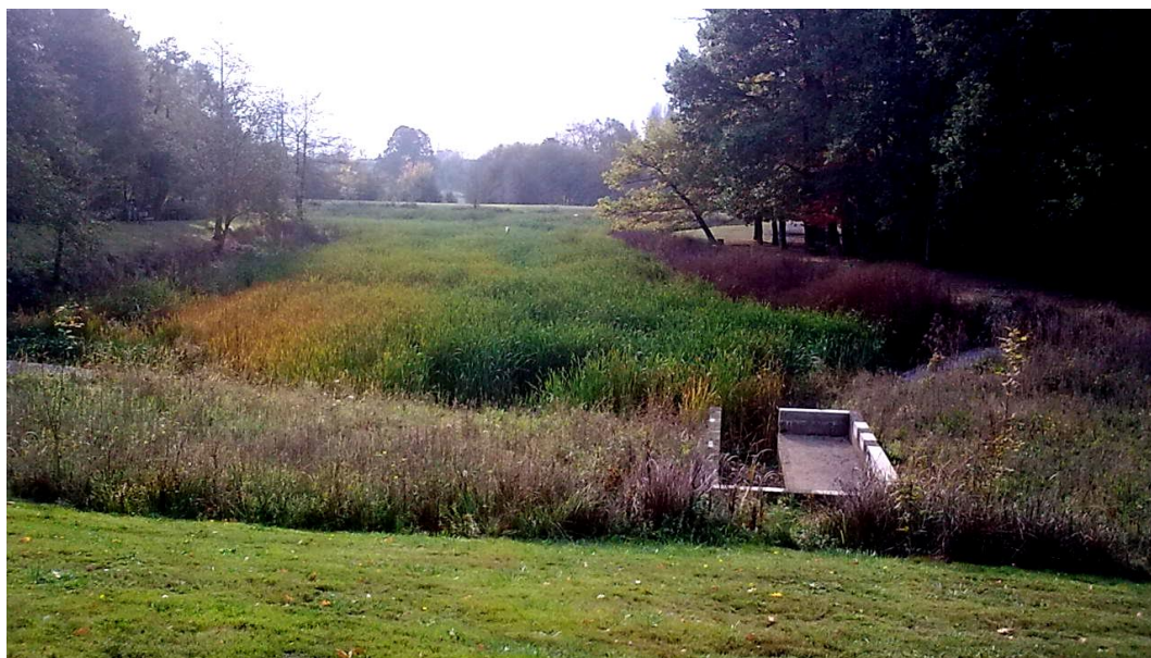
ETANG AVAL : situation au 29 octobre 2011

Association Agréée de Pêche et de Protection du Milieu Aquatique